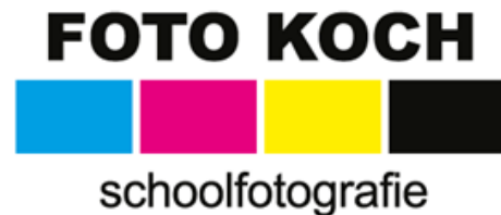
Foto Koch komt maandag 12 september 2022 de schoolfoto's maken. Er komen twee fotografen om alle foto's in één dag te maken.